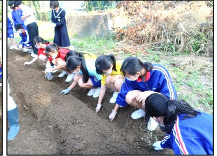
＜うね作りや種まきをする様子＞