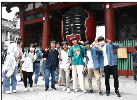
＜2日目：浅草、日本科学未来館での分散の様子＞