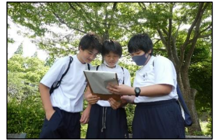
＜戸田川緑地の方の話の聞いたり、調べ学習をしたりする様子＞