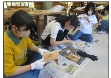
＜1日目：飯ごう炊さんでのカレー作り、キャンプファイヤーの様子＞ <2日目：民芸教室の様子＞