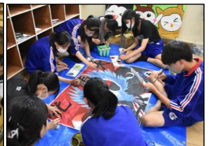
＜学級旗の下書きや、絵の具で着色をする様子＞