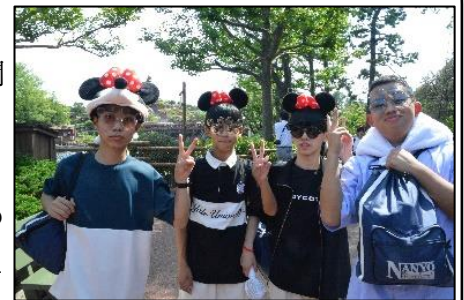
＜1日目：ディズニーランドの様子＞

「一期一会」～夢の旅へGO!GO!!～のスローガンのもと、2泊3日で修学旅行に行きました。1日目は東京ディズニーランドで楽しい時間を過ごし、ホテルエミオン東京ベイに泊まりました。2日目はクラス分散、カップヌードルミュージアム&横浜中華街、国立科学博物館&浅草寺、日本科学未来館&東京タワーで分散学習を行いました。その後、清里高原のペンションに行き、各クラス男女別に泊まりました。3日目は滝沢牧場に行き、乳しぼり体験などの自然体験学習を行いました。