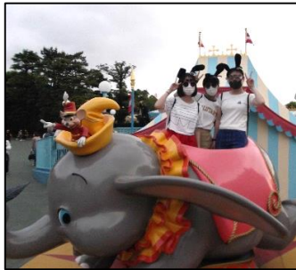
＜1日目ディズニーランド＞

「211人の団結力」～笑顔と感謝を忘れずに！～のローガンのもと、3日間にわたって修学旅行を行いました。1日目は東京ディズニーランドを班ごとに巡り、存分に楽しむ姿が見られました。2日目は上野から浅草まで、クイズをクリアしながら歩くフォトアドベンチャーラリー。猛暑の中、仲間と協力しながら浅草にたどり着きました。浅草分散の後は清里高原に赴き、クラスごとに分かれてペンションでお世話になりました。ペンションのオーナーさんたちはステキな人ばかりで、様々な体験をしたり、仲間と食事をしたりする中で、かけがえのない思い出をつくることができました。