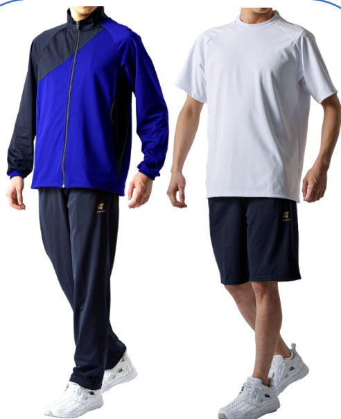
＜決定した体操服のデザイン＞