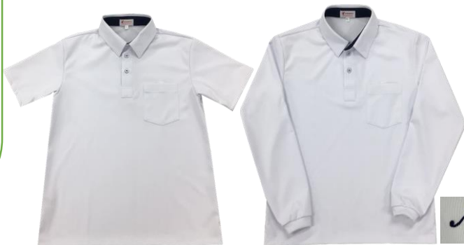
＜半袖・長袖ポロシャツ・左袖に入る刺繍＞