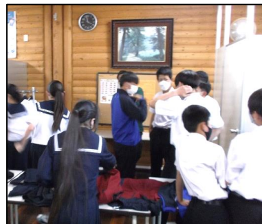
＜5月25日（水）に行われた新制服・体操服決定に向けた生活・体育合同委員会の様子＞