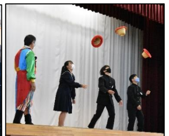
<獅子舞や、パフォーマンスに挑戦する様子>