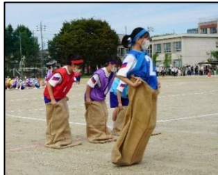
<障害物リレーの様子>