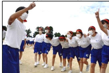
<8の字跳びの前の円陣の様子>