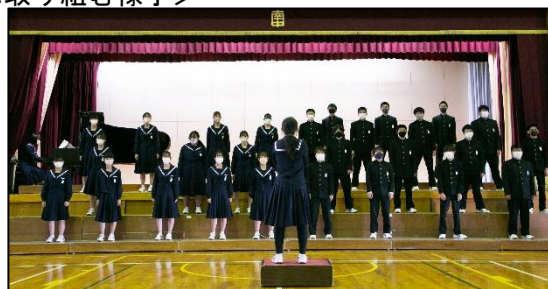
<合唱コンクール本番当日の様子>