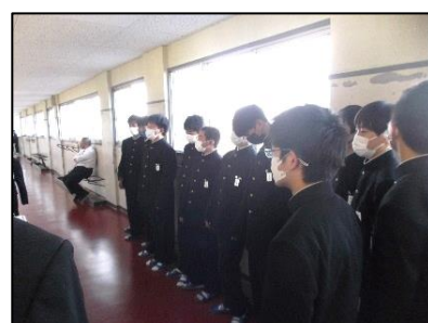
<合唱コンクールに向けて練習に取り組む様子>