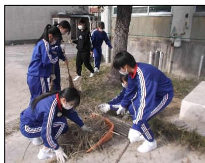
<校庭の草を清掃する様子>