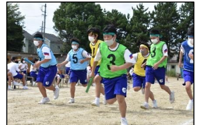
<リレーを走る様子>