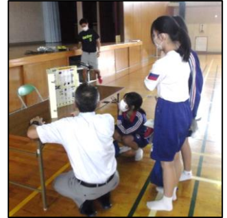
<薬物サンプルを見る様子>